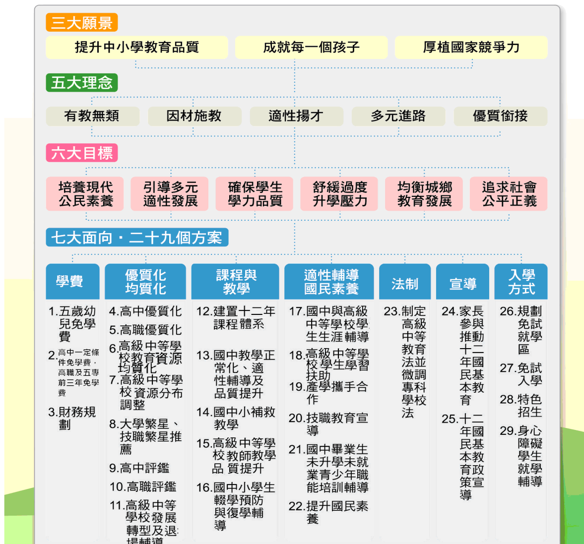
十二年國民基本教育的願景、理念、目標、方案關係圖